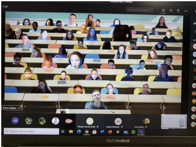
Groep 8 digitaal in de schoolbankjes